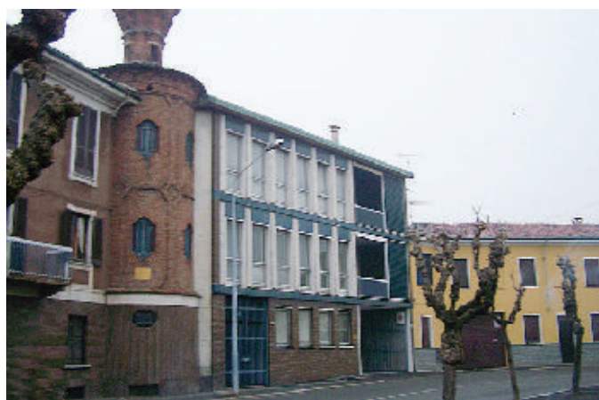
Prosegue la crisi all'azienda tessile Liontex di Trecate

Problemi che toccano anche altre aziende del territorio, come la «Michele Letizia» di Cerano: «La società si sta lentamente ridimensionando -